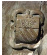
Les armes de Nicolas PERRENOT de GRANVELLE