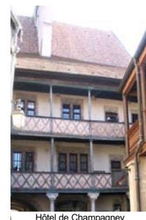
Hôtel de Champagny