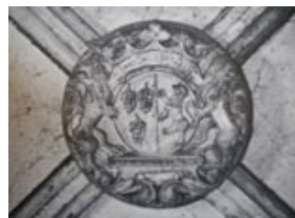
Blason BUN et REGNAULDOT